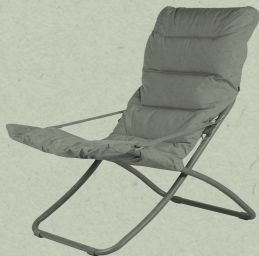
FIESTA XL SOFT