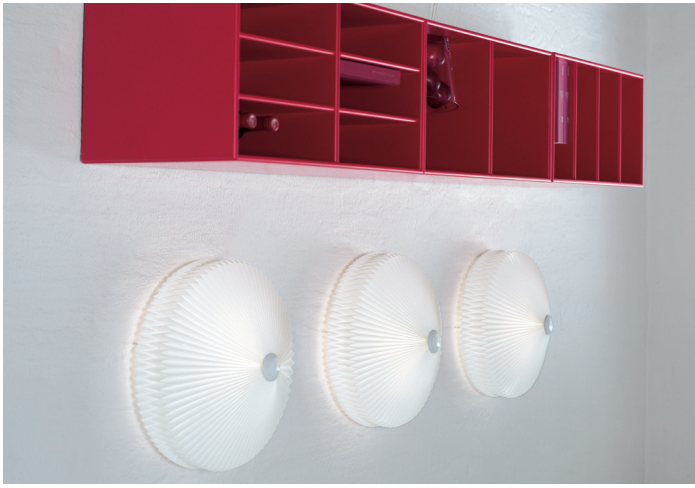
Vægslampen model 209, designed af Tage Klint. The wall lamp model 209, designed by Tage Klint.