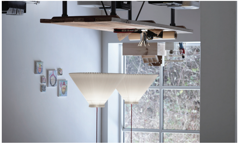
Den klassiske model 1, designed af Tage Klint i 1942.

Tage Klint added the unique collar to the original Klint lampshades, which exploits the elasticity in the material, allowing the shade to fit firmly in place on a stand. Tage Klint also designed a number of lamps, of which some are still part of the LE KLINT product range.